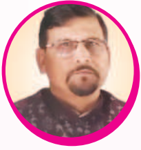
ସରୁପ ପାଣିଗ୍ରାହୀ ସଭାପତି

ପଶ୍ଚିମ ଓଡ଼ିଶାର ଶିକ୍ଷା ଡିଭିନ୍ସ ନୂଆଁଖାଇଲୀ ସମସ୍ତଙ୍କୁ ମୋର ନୂଆଁଖାଇ ଜୁହାର । ନୂଆଁଖାଇ ଭେଟ୍‌ଘାଟ୍ ୨୦୨୪ର ଶୁଭ ବେଳାନ ଆମର ପରିଷଦର ଇ-ମେମ୍‌ବର୍‌ଜିନ୍ ‘ଝୁଲକା’ ପ୍ରକାଶିତ ହେବାର୍‌ଟା ଆମର ଲାଗି ବହୁତ୍ ଖୁସି ଆଉ ଗର୍ବର କଥା । ଠିକ୍ ବେଳାଠି ମେମ୍‌ବର୍‌ଜିନ୍ କେ ସମ୍‌କର ପାଖେ ପହଂଚେଇ ଥିବାର ଲାଗି ମୁଇଁ ଇ-ମେମ୍‌ବର୍‌ଜିନ୍‌ର ଟିମ୍ ଆଉ ସବୁ ସଦସ୍ୟମାନଙ୍କୁ ମୋର ଅଭିନନ୍ଦନ ଜନଉଁଛେଁ । ଆମର ପରିଷଦର ସଦସ୍ୟମାନଙ୍କର ଅକ୍ଳାନ୍ତ ପରିଶ୍ରମ୍ ଆଉ ଚେଷ୍ଟା ଲାଗି ୨୦୨୪ରେ ଗୁରୁଦୁଟେ ସଂସ୍କୃତିକ୍ ଆର୍ ସମାଜ- କଲ୍ୟାଣକାରୀ କାର୍ଯ୍ୟକ୍ରମମାନେ ସଫଳତାର ସହ ସମ୍ପାଦିତ ହେଇଛେ । ଆମର ପରିଷଦର ସଭ୍ୟସଂଖ୍ୟା ବଢ଼ାବାରେ ଭି ଆମେ କିଛିଟା ସଫଳ ହେଇଛୁଁ । ଇହାଦେ ଆମର ପରିଷଦ୍‌ରେ ୧୫୦ ଉପରେ ଆଜୀବନ ସଭ୍ୟ ଅଛନ୍ । ଇ ସଂଖ୍ୟାକେ ବଢେଇ କରି ଆମର ପରିଷଦ୍‌କେ ଆହୁରି ମଜବୁତ୍ କରବାର ଲାଗି ମୁଇଁ ପରିଷଦ୍ କର୍ମକର୍ତ୍ତାମାନଙ୍କୁ ଅନୁରୋଧ୍ କରୁଛେଁ ।